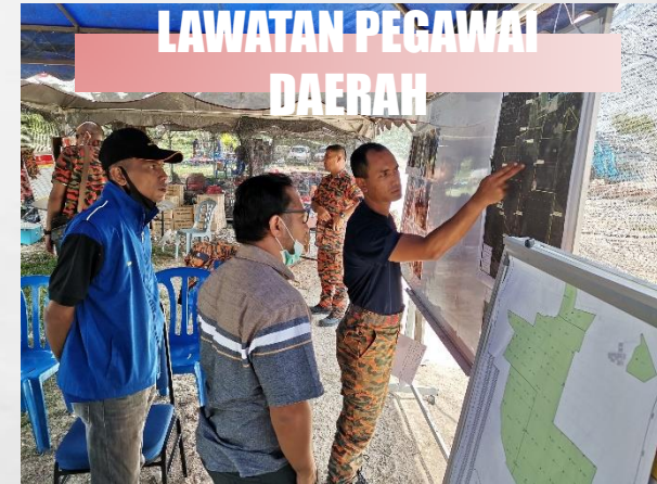
LAWATAN PEGAWAI DAERAH