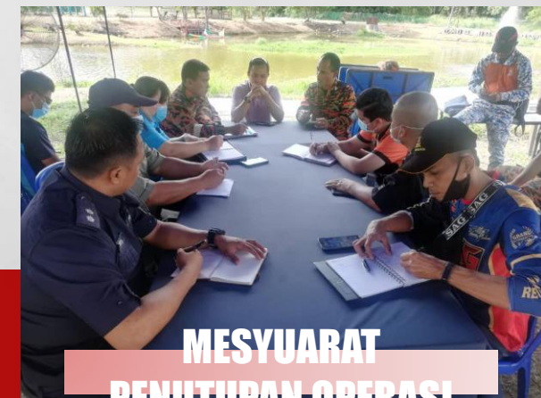
MESYUARAT PENUTUPAN OPERASI