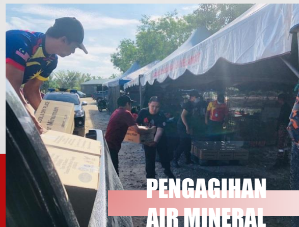
PENGAGIHAN AIR MINERAL