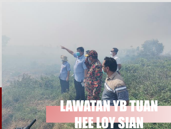
LAWATAN YB TUAN HEE LOY SIAN